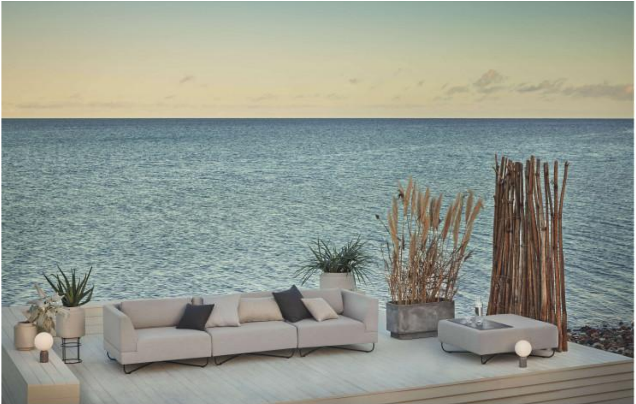
Le système de canapé Orlando (Bolia) dans sa version outdoor.

Présent dans le catalogue Bolia depuis 2004 , le système de canapé Orlando a construit son succès sur sa modularité qui lui permet de s'adapter à toutes les pièces. Ce printemps, il débarque dans une version outdoor qui comprend un module d'angle, un module de dos, deux assises sans dossier/tables d'appoint et des coussins de dossier disponibles en deux longueurs. De quoi composer une zone de repos extérieur sur mesure.