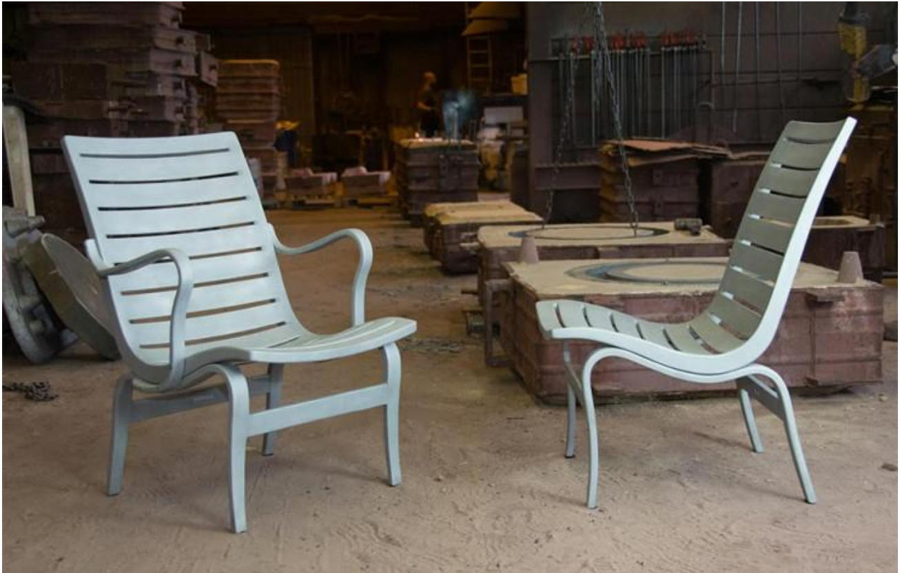
La chaise Eva de Bruno Mathsson en version tout alu.