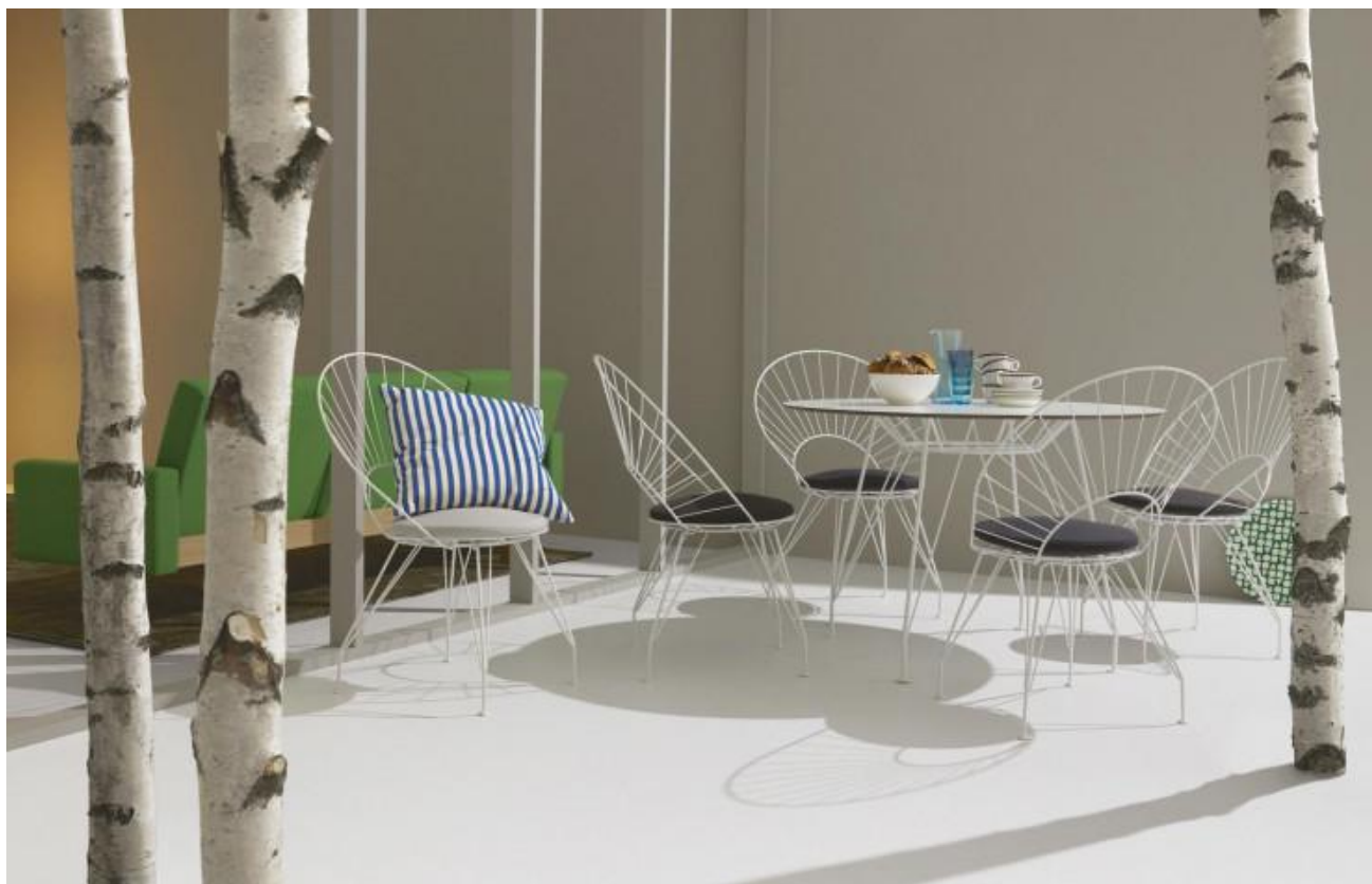
Chaises Désirée (Swedese).