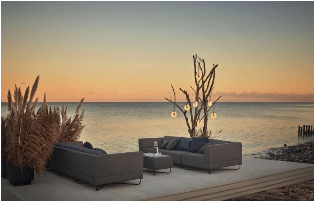
Sofa Orlando (Bolia).