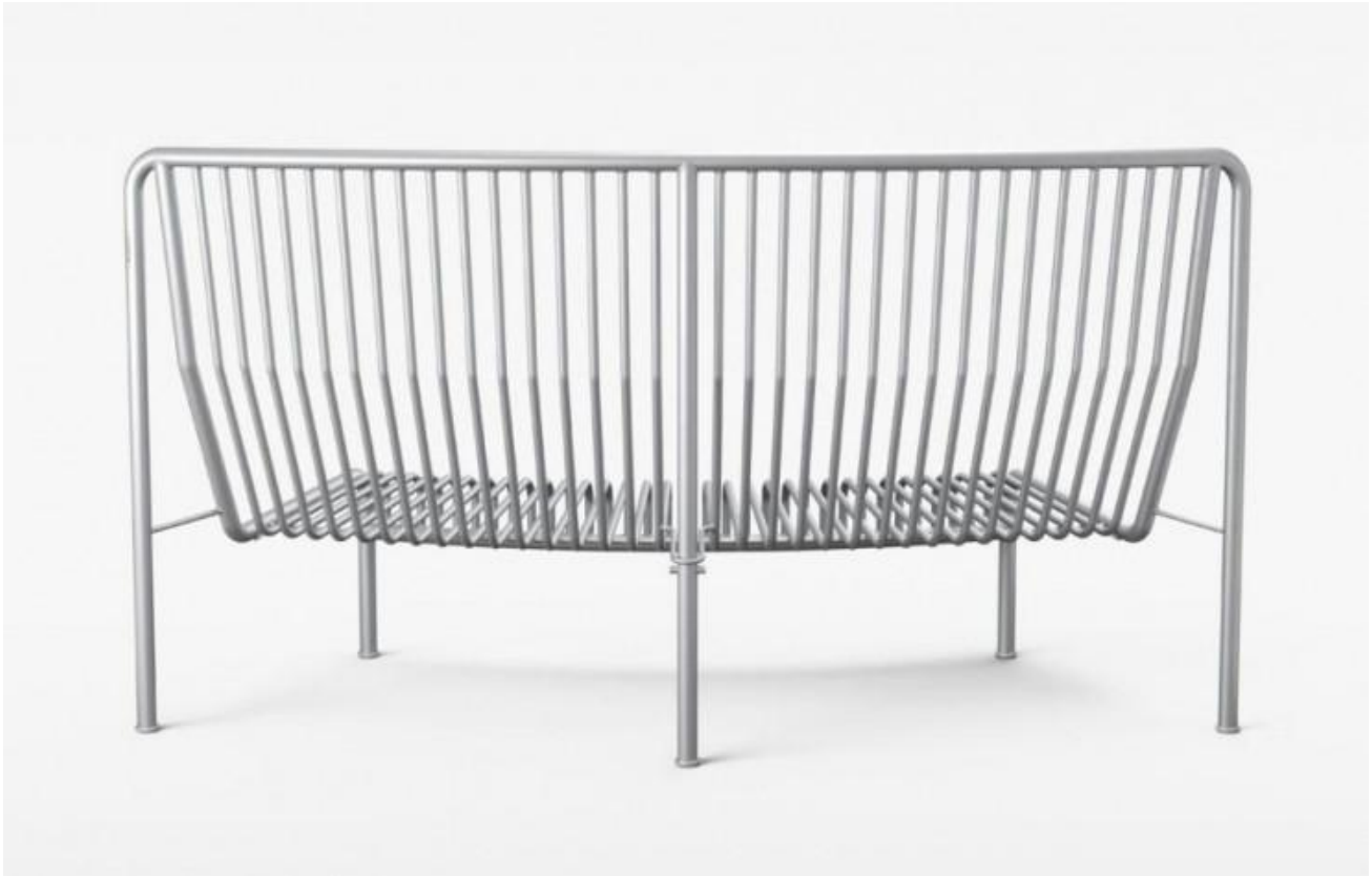
Banc Roadie (Massproductions).