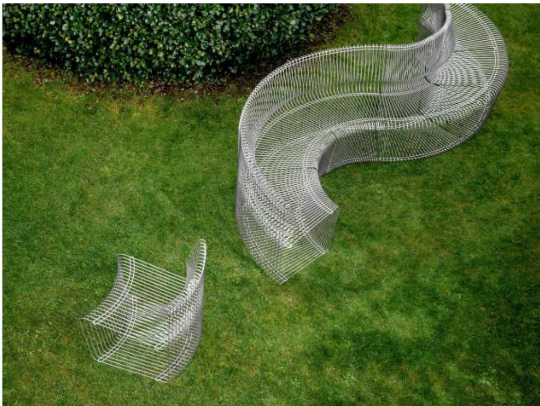
Le Pantonova serpente dans le jardin.

> Banc Pantonova, Montana, à partir de 1#155 € le module.