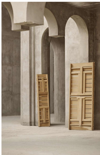
La collection une fois repliée.