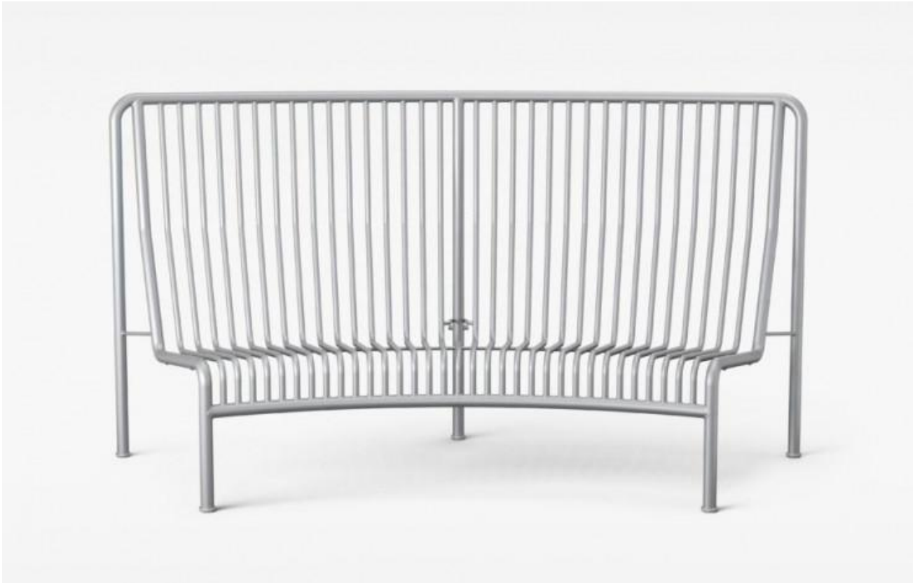
Banc Roadie (Massproductions).