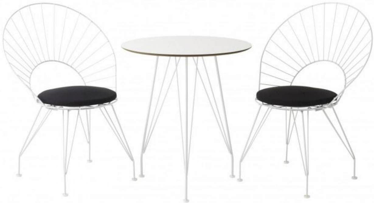
Salon de jardin Désirée (Swedese).