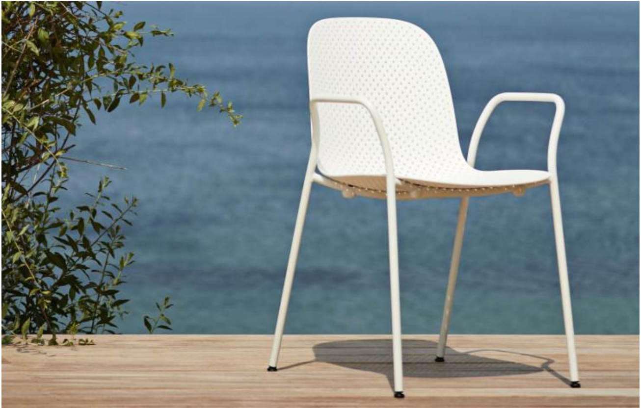
Chaise 13Eighty de Scholten & Baijings (Hay).

L'éditeur danois qui a déjà un best-seller de l'outdoor à son actif avec la collection Palissade des Bouroullec, a demandé à Scholten & Baijings de penser des chaises pour l'extérieur dans lesquelles injecter leur poésie moderne. Les Hollandais ont choisi de percer dossier et assises en polypropylène de 1380 trous de formes différentes, qui allègent sa silhouette et permettent d'évacuer les eaux de pluie.